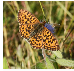
Identification : ... Auteur ... Nom fichier eefDSC0662 Prise de vue 3 sept 2018 Butte aux Pierres - Briere plantes hôtes : cirse anglais ou centauree