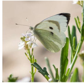
Identification : ... Auteur ... Nom fichier eef8493 Prise de vue 4 octobre 2017 SAINT-NAZAIRE plage du grand trait plantes hôtes : cakillier