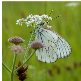
Identification : gazé Auteur ... Nom fichier eef 180514Prezegat Prise de vue 29 mai 2018 SAINT-NAZAIRE PREZEGAT friche sous la 2x2voies plantes hôtes : une ombellifère...