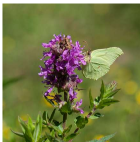
Auteur ... Nom fichier eef DSC2571 Prise de vue 26 juin 2018 BRECA prairie naturelle plantes hôtes : salicaire, cirse, brunelle